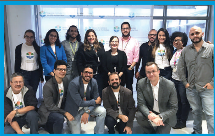
PRVCU Team: Community Symposium

{ The Puerto Rico Vector Control Unit (PRVCU) held its first Community Collaborators Symposium, to present to the participants the PRVCU and how to integrate the communities in the process of development and planning of the same. It was attended by about 70 people and provided an opportunity to learn how each entity can participate and contribute to the successful implementation of programs such as Integrated Vector Management (IVM), the main initiative of the Unit. This was an ideal opportunity to learn how each entity can participate and contribute to the successful implementation of programs such as Integrated Vector Management (IVM), the main initiative of the Unit. }